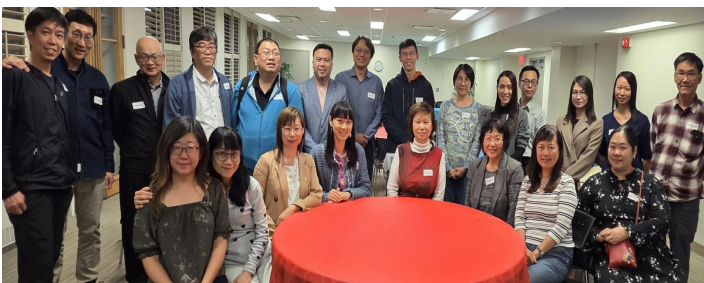
牧者全人健康大搜查

(3) 近年有20 多位香港移民，入讀天道神學院。為了 關顧華人神學生，中心於去年10月19日舉辦感恩 節晚餐及「牧者全人健康大搜查」，交流活動，提 供資訊。有23位出席。